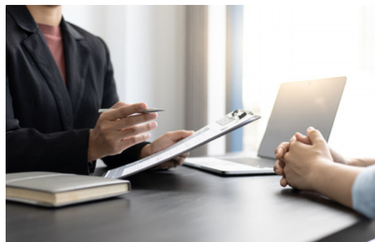
Talentide värbamine ja meeskonna kujundamine