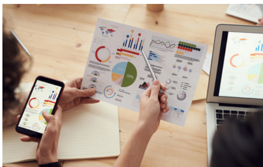
Organisatsiooni uuringud ja töökogemuse kujundamine