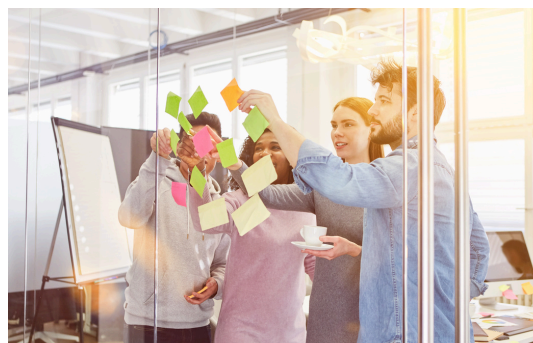
Koolitused ja meeskonna töötoad