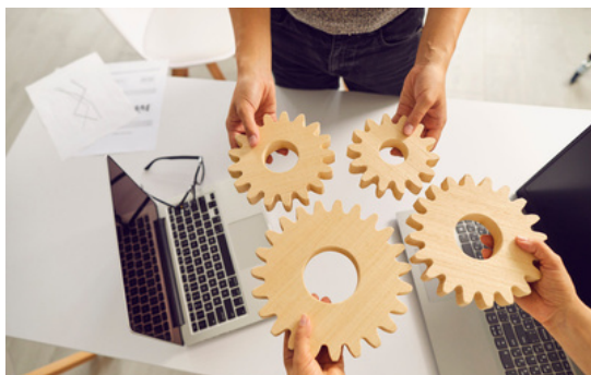
Personalijuhtimise strateegia ja protsesside disainimine